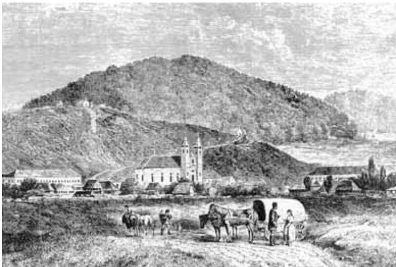
Csíksomlyó a Nagy- és Kis-Somlyó nevű hegyek háttérében (Rajz: Keleti Gusztáv)

A múlttal szemben alapvető változás a rohamosan növekvő városi népesség nemzetiség szerinti megoszlásában következett be. 1910-ben az akkori városok összességének 683 ezres létszámából közel 65 százalék volt magyar és 16 százalék német. Az 1977-re 3559 ezerre felduzzasztott városi népességben a magyarok részaránya 23, a németeké 4 százalékra csökkent. S míg nyolcvan éve a 18 százalékot sem érte el a román városlakók aránya, 1977-re ez közel 71 százalékra futott fel.